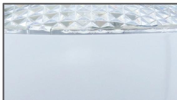
ตัวครอบดวงโคม ใช้วัสดุพลาสติก ABS