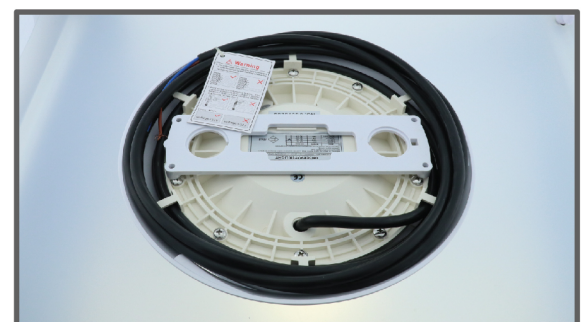
ก้านหลังโคมไฟแบบแปะผนัง ติดตั้งง่าย